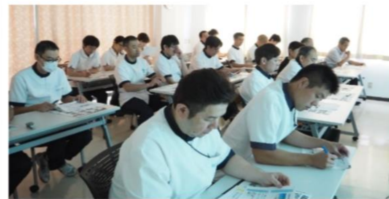
ガーデンマッサージ治療院 研修風景

スウェーデン発祥のタッチケアで、手で患者様の背中や手足を柔らかく包み込むように触れることで、不安やストレスを軽減しそれに伴う症状を緩和する効果が期待できるとされています。